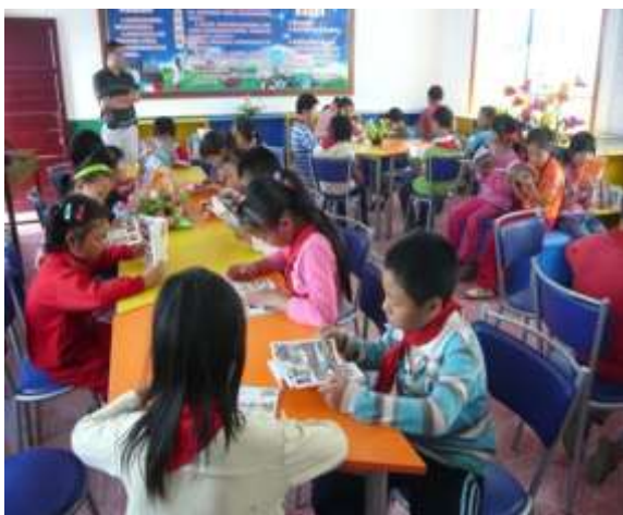
參與計劃學校的學生都已有看書的習慣和興趣，他們平日也可借書回家

有關基金的詳細工作，歡迎到以下網址瀏覽： www.readingdreams.org.hk